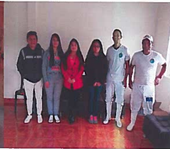
Empresa Biolacteos Santa Clara