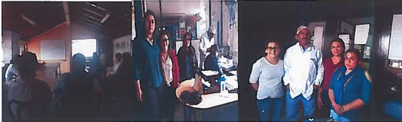
Capacitación empresa MILMALAC

(Documentación, Fotografías, Videos que corroboren las actividades llevadas a cabo hasta la fecha)