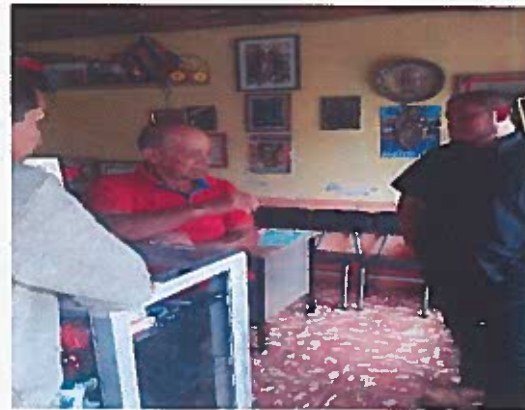
Asociación Manos Productivas de Mira