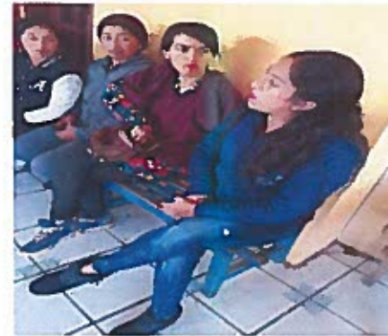
Capacitación empresa ALMAWA