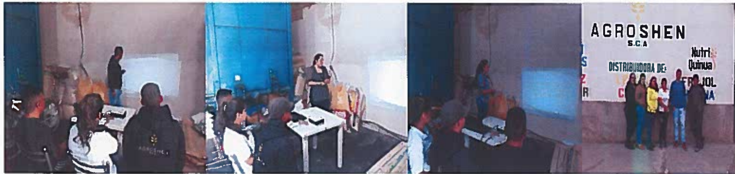
Capacitación empresa AGROSHEN