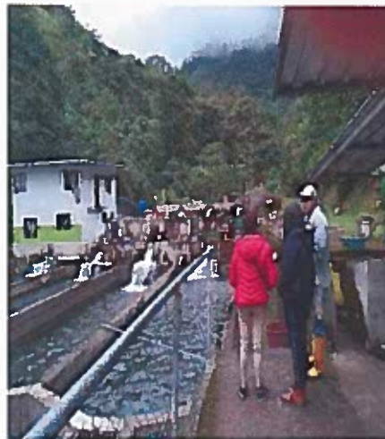
Empresa Mykiss ASOARNECIS