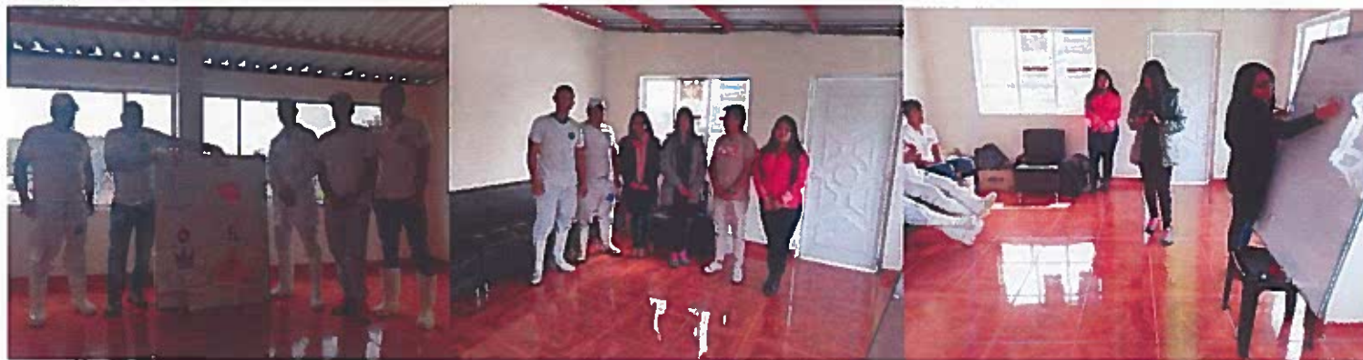
Capacitación empresa Biolácteos Santa Clara

Universidad Politécnica Estatal del Carchi Av. Universitaria y Antisana Teléfono: 062224079/062224080 ext. 1126-1128 Tulcán – Carchi - Ecuador