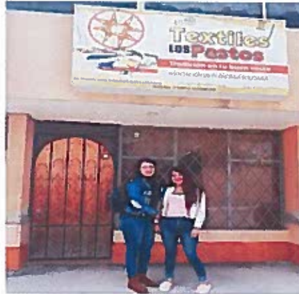
Empresa los Pastos