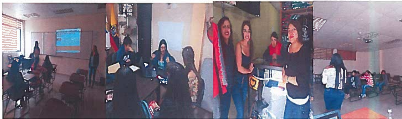
Capacitación empresa ASOTULTEX