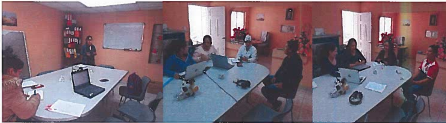
Capacitación empresa PRODALSAN